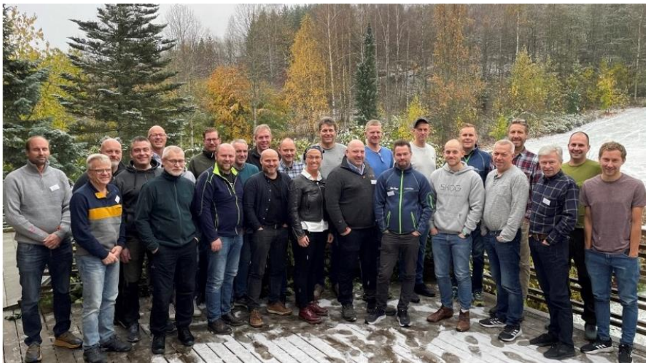
Bildet tatt på faglærersamling for skoler med VG2 skogbruk. Det kan se ut som vi har en jobb å gjøre når det gjelder å motivere kvinner til å bli praksislærere.

Utstyrs- og løsningsleverandør Stihl har vært vår sponsor i mange år, og vi har høsten 2021 reforhandlet og styrket samarbeidet. Nytt er muligheten å kjøpe inn lettere sag-utstyr til utprøving i skolene. Det vil gi nyttig kunnskap for både elever, skoler, Kvinner i Skogbruket og Stihl.