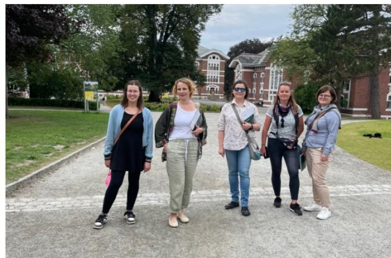
Fra «Jämställdhet i skogsbruket», Interreg-arbeidet «skogsjobb i grenseland», Krasjkurs i skogbruk, faginnlegg for SNS, skolebesøk på KVS Bygland og besøk fra vår søsterorganisasjon i Polen.